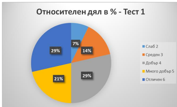
Фигура 1 Резултати от Тест 1

Цел на теста е да се определи нивото на знание за текст, умения на учениците, свързани с намиране връзката между заглавие и текст, вникване в прочетеното, откриване на герои, опорни думи, разграничаване на видове текст.